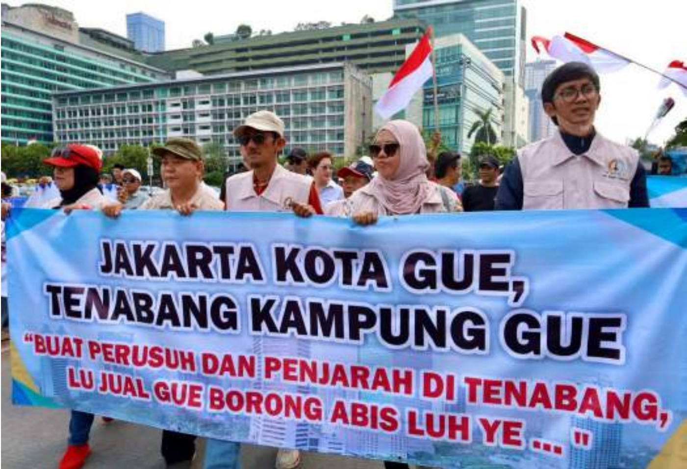
Deklarasi Damai, warga Kecamatan Tanah Abang di Bundaran HI.

Kesra 1 Sep, 2025 Reporter: Rio Cornelianto | Editor : Andreas Pamakayo