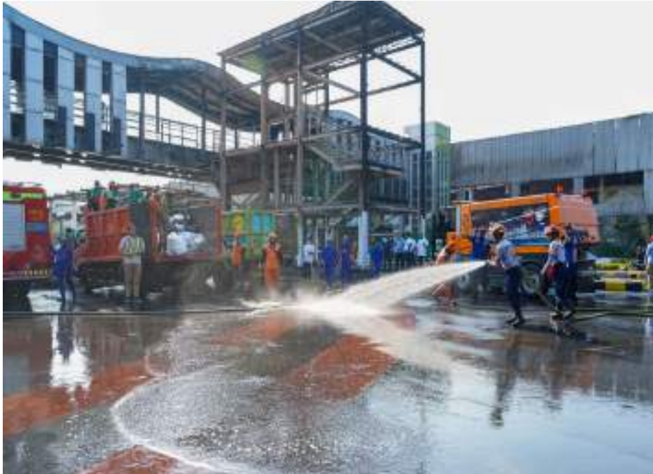
Gotong royong membersihkan halte di kawasan Simpang Lima Senen.