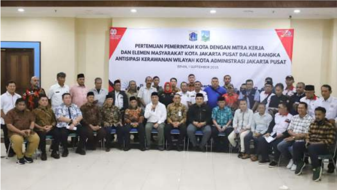
Deklarasi damai bersama mitra kerja dan elemen masyarakat.

Pemerintahan 1 Sep, 2025 Reporter: Muhammad Aulia | Editor : Andreas Pamakayo