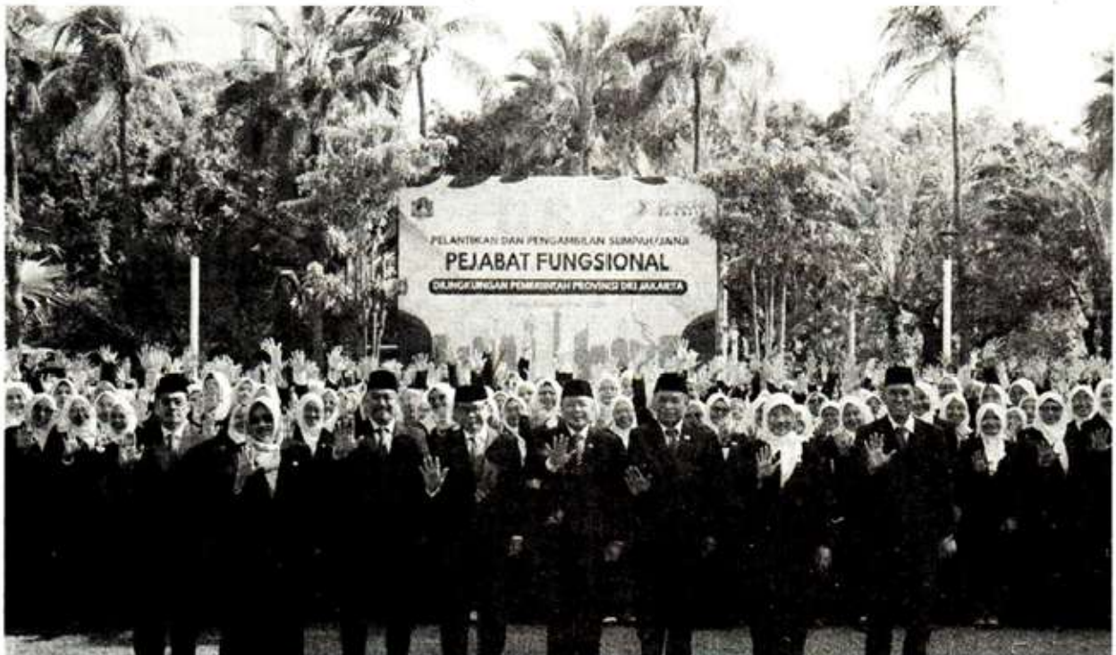
LANTIK: Gubernur Jakarta, Pramono Anung usai melantik 992 pejabat fungsional ASN Pemprov DKI Jakarta di Balai Kota DKI Jakarta, Rabu (3/9).

Ia juga mengingatkan agar para pejabat fungsional menjaga ketertiban serta fasilitas umum yang menjadi milik warga Jakarta. “Fasilitas tersebut harus dijaga bersama dan dimanfaatkan untuk kepentingan masyarakat,” katanya. (CR-4)