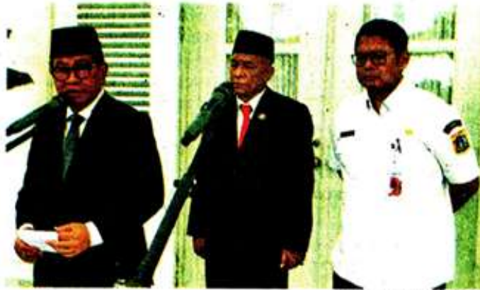
Warta Kota/Yolanda Putri Dewanti

"Untuk work from home yang kemarin sudah sempat diadakan, karena (saat ini) kondisinya sudah menjadi