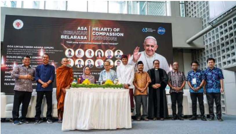
Asekbang menghadiri Asa Gerakan Belarasa di Museum Nasional Indonesia.

Kesra 3 May, 2025 Reporter: R Maulana Yusuf | Editor : Andreas Pamakayo