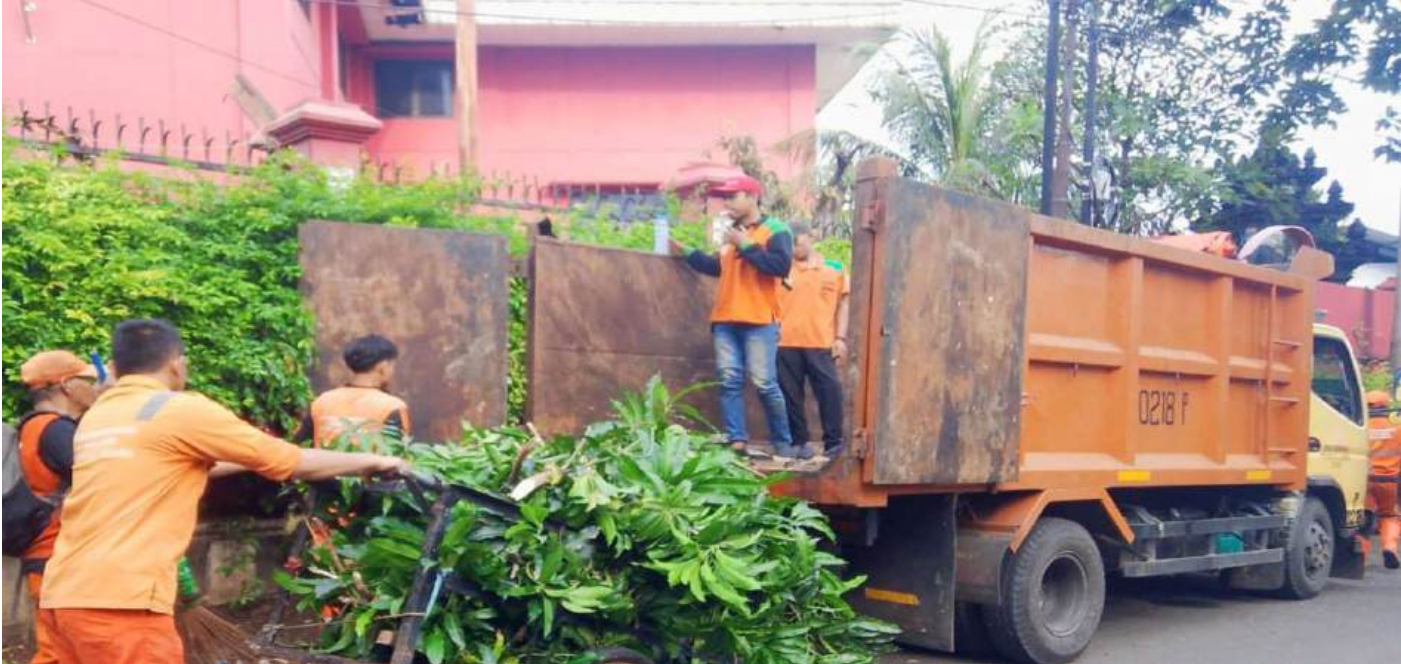
Pasukan Warna-warni Kecamatan Tanah Abang - Sedang Mengangkut Sampah Kerja Bakti ke KDO Truk Typer Satpel LH Kecamatan Tanah Abang