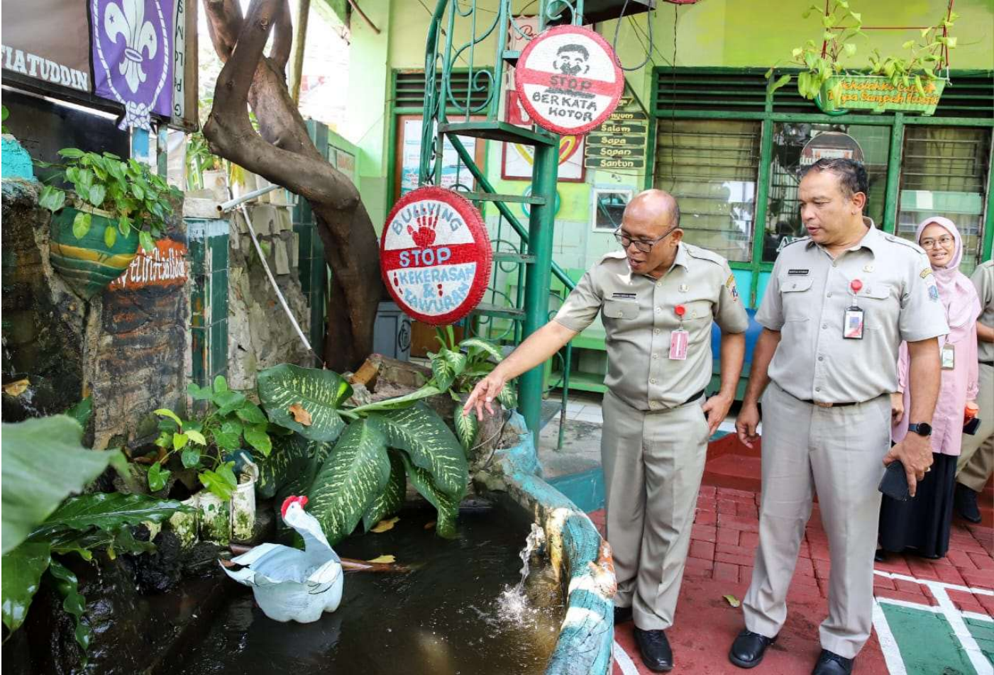
Asekbang tinjau sekolah calon Adiwiyata.

Perekonomian & Pemb 5 May, 2025 Reporter: Berlian Sigit | Editor : Andreas Pamakayo