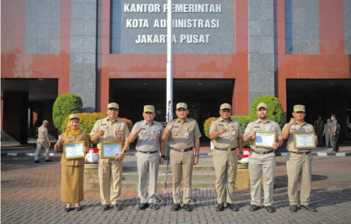
Pemkot Jakarta Pusat Terima Penghargaan Pelayanan Prima 2024 dari KemenPAN RB