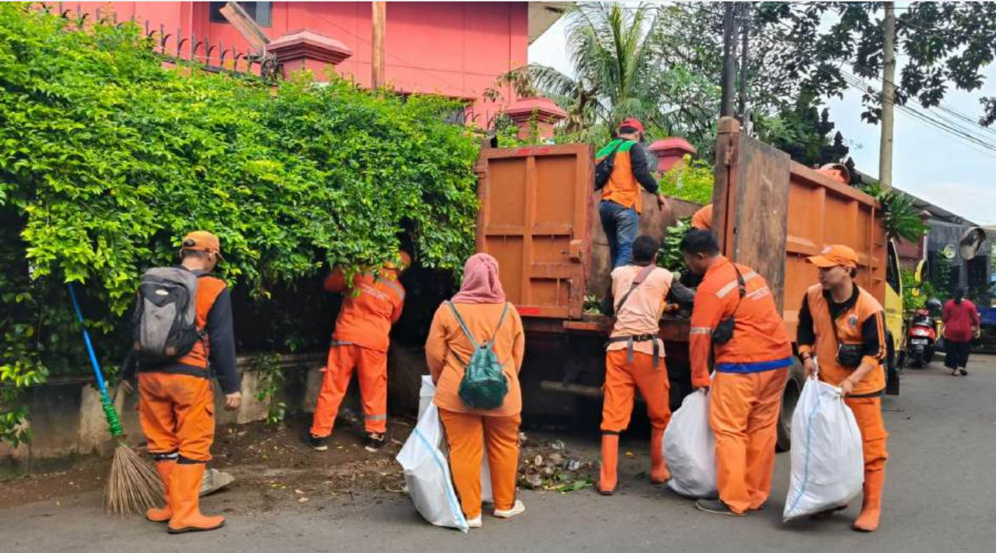
Kerja bakti di RW 02 Kelurahan Gelora.