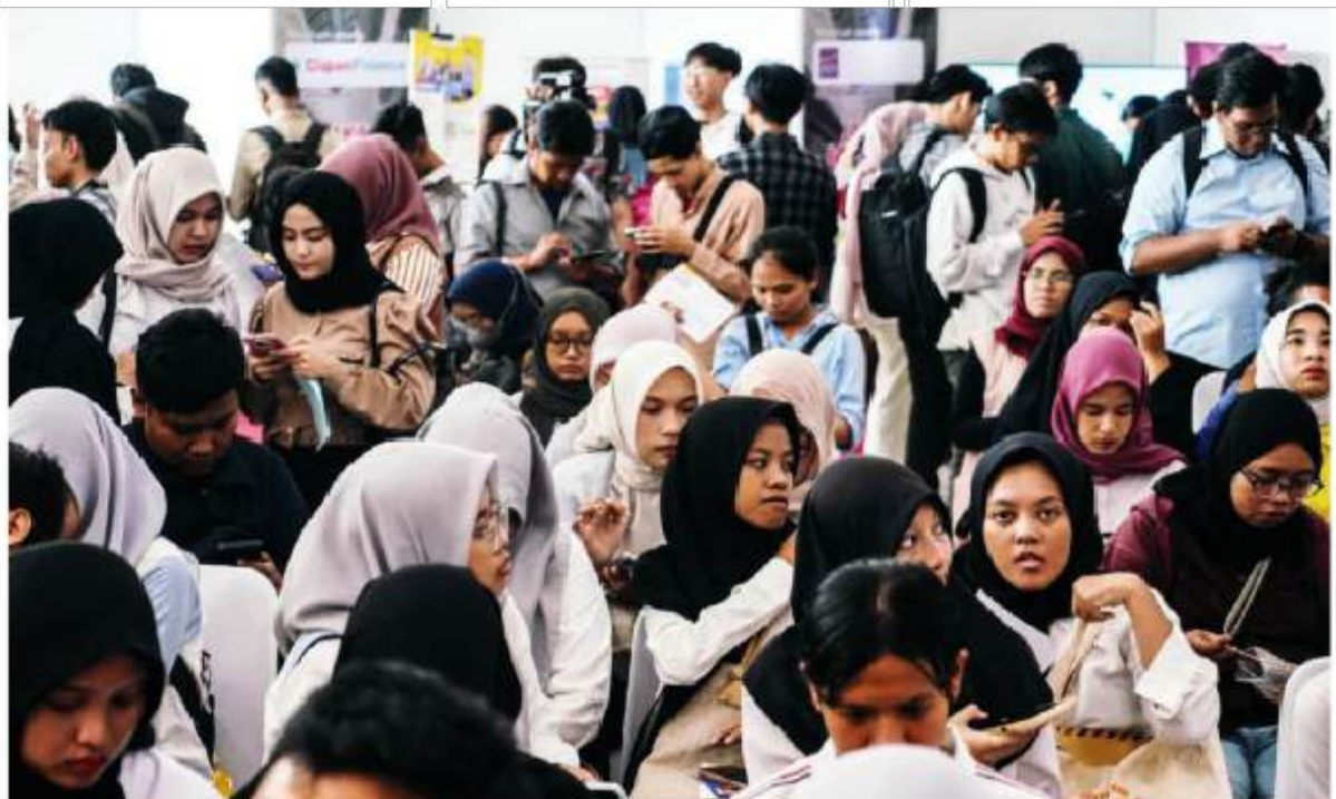
CARI KERJA - Sejumlah pencari kerja mengunjungi job fair di GOR Kemayoran, Jakarta, Selasa (6/5). Badan Pusat Statistik Provinsi Jakarta menyampaikan jumlah warga Jakarta yang jadi pengangguran per Februari 2025 bertambah 10 ribu orang, sehingga totalnya sekarang menjadi 338 ribu orang.

Di sisi lain, ia mengusulkan agar ruang-ruang kosong di pusat perbelanjaan bisa dimanfaatkan sebagai lokasi usaha UMKM tanpa dipungut biaya sewa. “Mal-mal yang kosong bisa diambil alih oleh Pemprov, disediakan untuk UMKM berjualan, tapi gratis ya,” katanya. (pan)