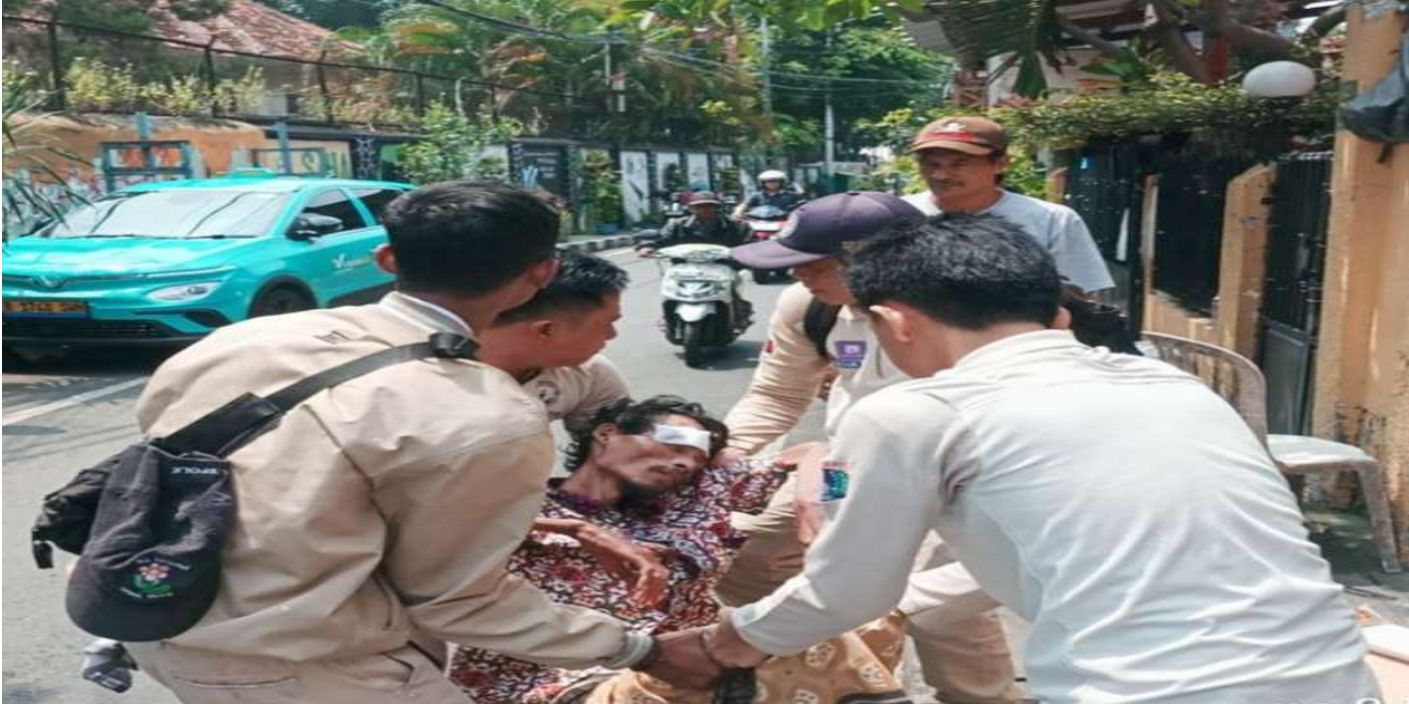
Satgas P3S Sudinsos Jakpus - Sedang Membantu Lansia Yang Ditemukan Sedang Sakit

HELOINDONESIA.COM - Terhitung ada sebanyak ratusan Pemerlu Pelayanan Kesejahteraan Sosial (PPKS) terciduk dalam operasi PPKS yang digelar Suku Dinas Sosial Sudinsos Jakarta Pusat (Jakpus)!di delapan wilayah.