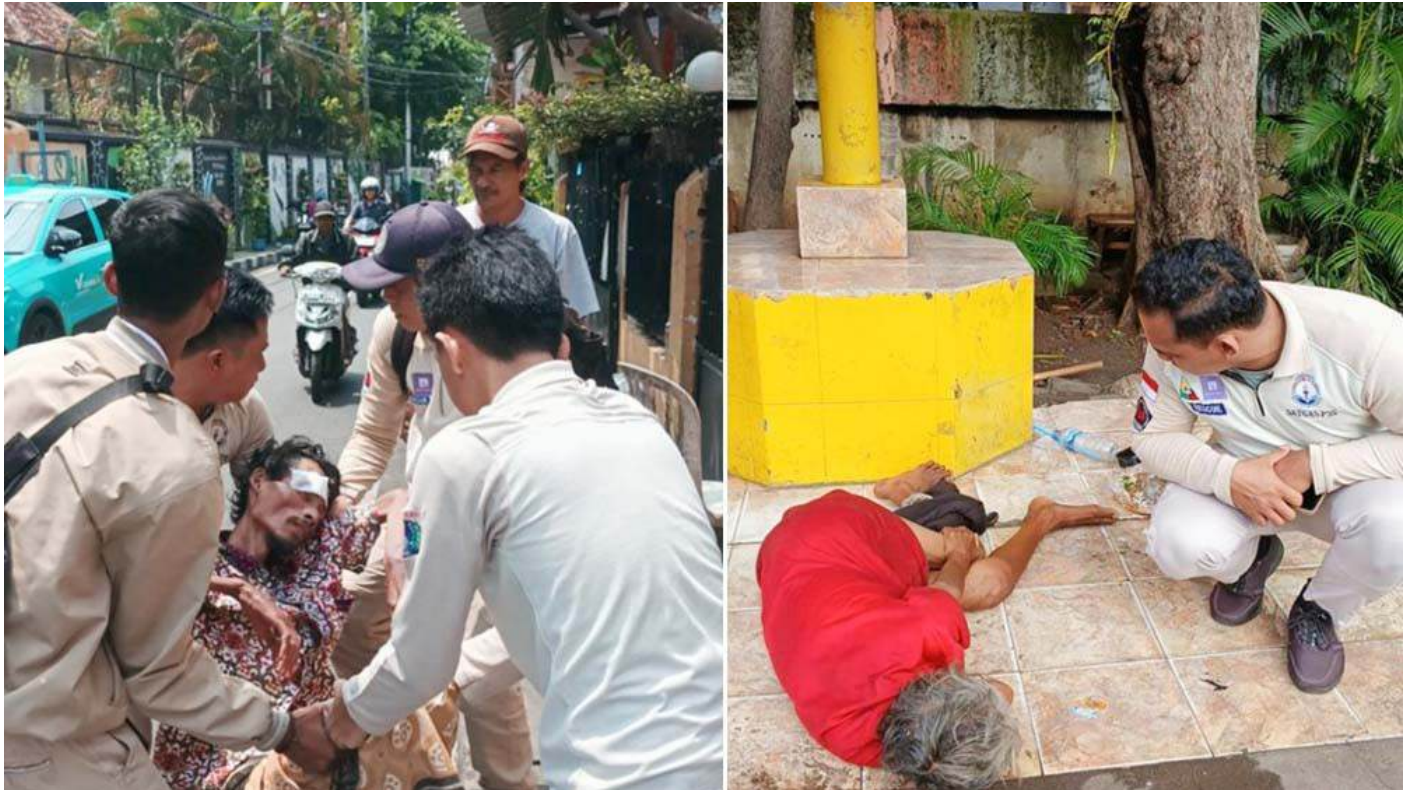
Satgas P3S Sudinsos Jakpus menemukan lansia sedang sakit dan memberi pertolongan, petugas juga menemukan lansia tertidur di halte bus.