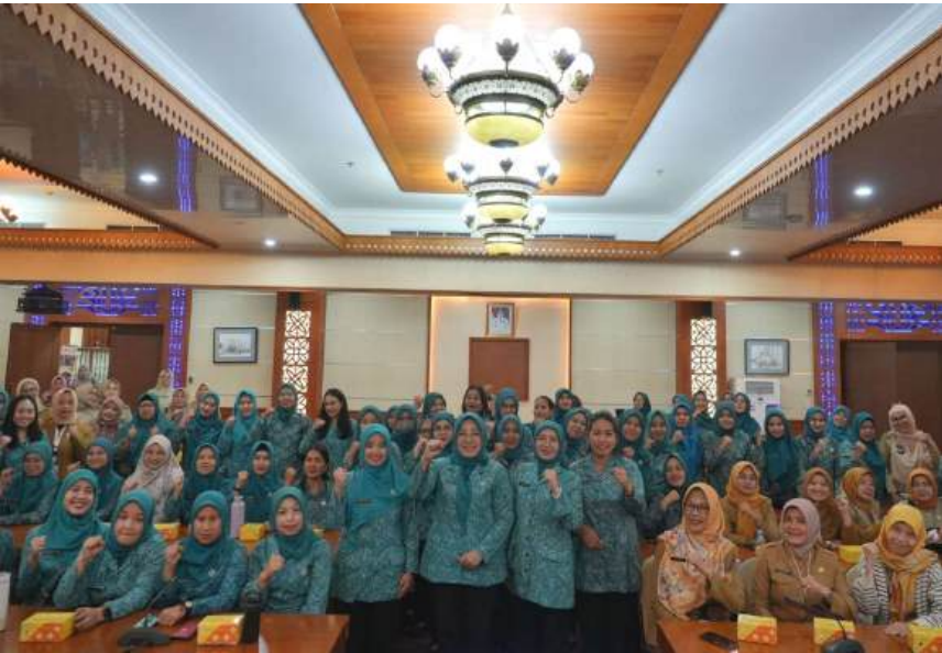
Pertin PKK Jakarta Pusat.

Kesra 6 May, 2025 Reporter: Ainaya Amartasya | Editor : Andreas Pamakayo