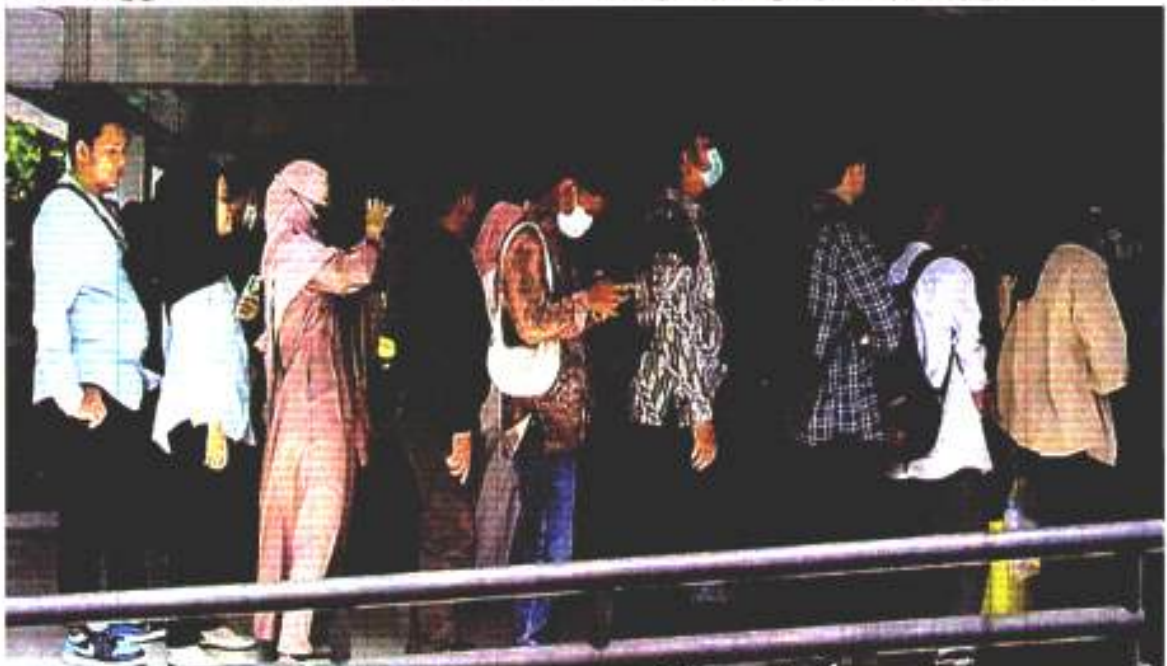
Para pencari kerja memdati kegiatan job fair di GOR Kemayoran, Jakarta Pusat, Selasa (6/5).