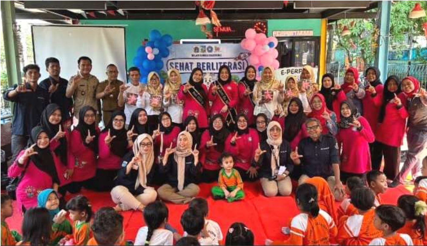
Sehat Berliterasi, di RPTRA Bonti.

Kesra 6 May, 2025 Reporter: Andre | Editor : Andreas Pamakayo