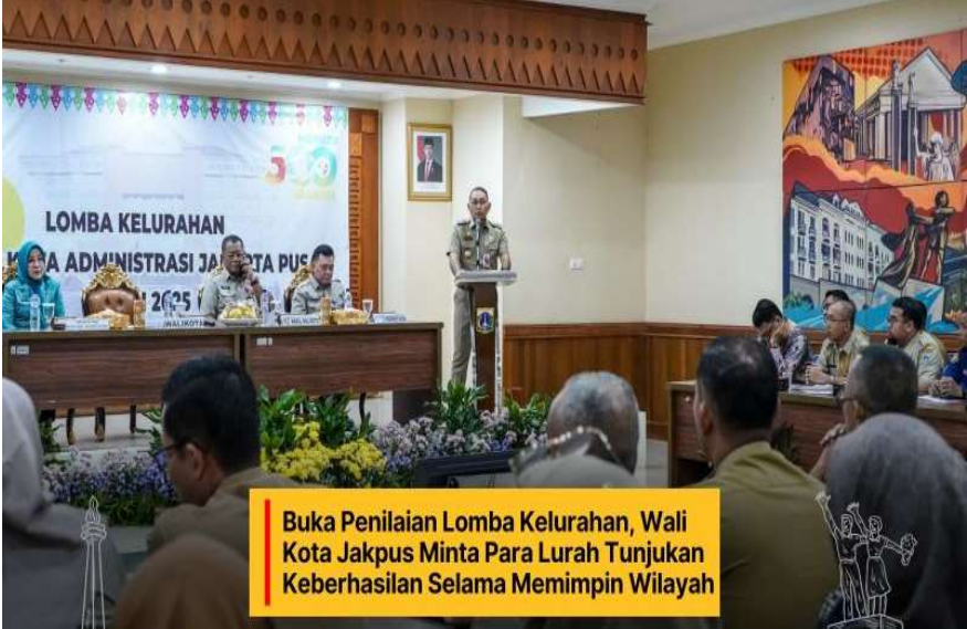
Foto: Drs. Arifin mengucapkan selamat kepada delapan kelurahan yang telah mewakili kecamatan

Redaksi OK - Jurnalis Selasa, 6 Mei 2025