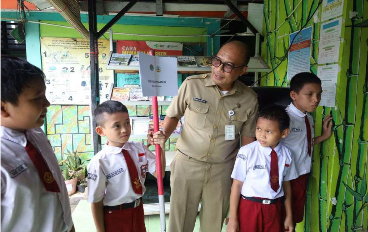
Peninjauan sekolah Calon Adiwiyata.

Perekonomian & Pemb 6 May, 2025 Reporter: Rio Cornelianto | Editor : Andreas Pamakayo