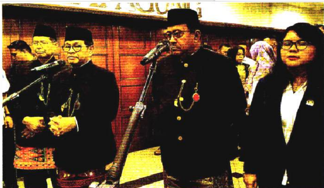
BERIKETERANGAN: Gubernur DKI Pramono Anung (dua dari kiri) didampingi Wakil Gubernur DKI Rano Karno setelah pelantikan pejabat Pemprov DKI kemarin (7/5).

Namun, dia tidak menampik, masih ada ASN Pemprov DKI yang enggan naik transportasi umum di Jakarta. Karena berdasar laporan yang diterimanya, kepatuhan atas kebijakan naik transportasi publik itu hanya sebesar 96 persen. Artinya, ada 4 persen yang tidak naik transportasi umum setiap Rabu. (rya/ind)