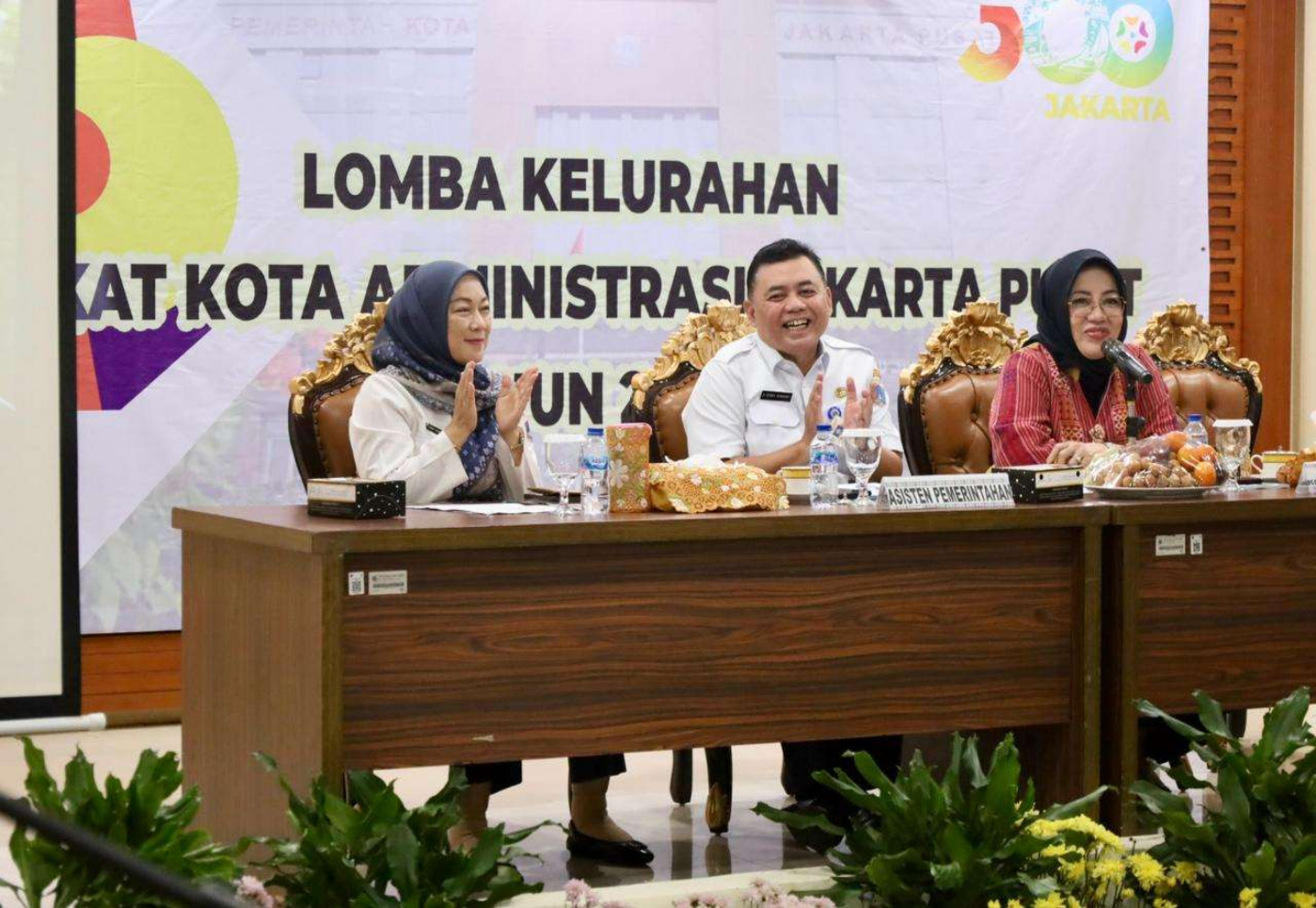
Aspem pimpin lomba Kelurahan Tingkat Kota.

Pemerintahan 7 May, 2025 Reporter: Andre | Editor : Andreas Pamakayo 35 View