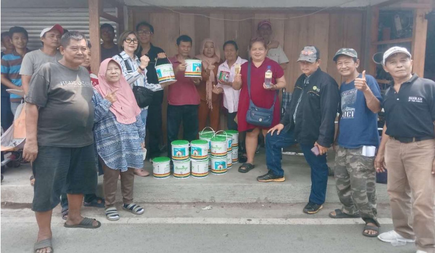
Pedagang Pasar Loak Poncol, Senen, terima bantuan cat pascakebakaran.

JAKARTA – Sebanyak 57 pedagang di Pasar Loak Poncol yang menjadi korban kebakaran mendapatkan bantuan cat dan kuas dari Paguyuban Pedagang se-Jakpus dan pengurus Lokasi Sementara (Loksem) JP Nomor 37 dan 38 Pasar Poncol Kelurahan Bungur, Kecamatan Senen, Jakarta Pusat.