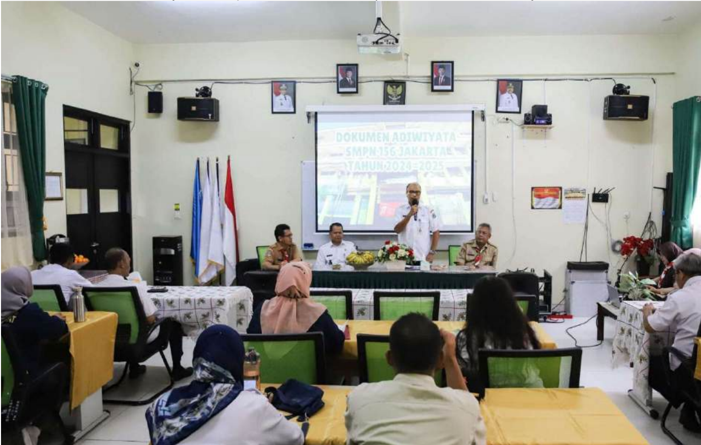
Pembinaan sekolah calon Adiwiyata.

Perekonomian & Pemb 7 May, 2025 Reporter: Rio Cornelianto | Editor : Andreas Pamakayo