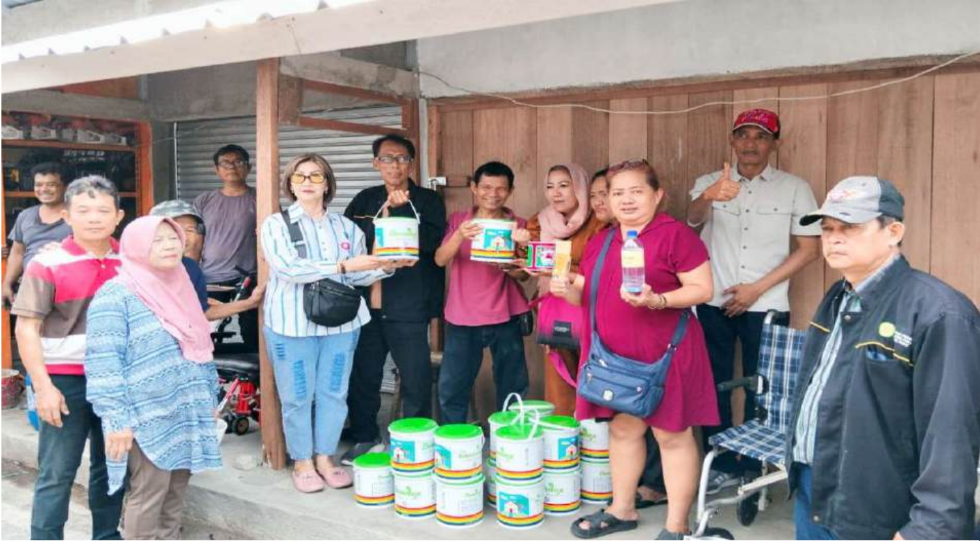
Paguyuban PKL se-Jakpus - Berfoto Bersama Usai Menyerahkan Puluhan Cat Kepada Pedagang Pasar Loak Poncol Bungur Senen Jakpus