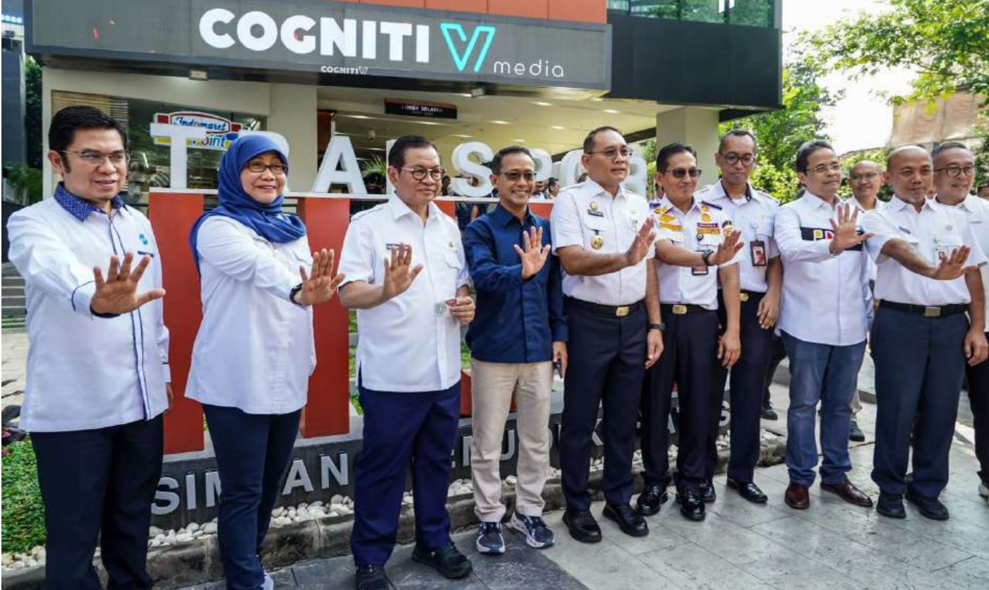
Peresmian Transport Hub Dukuh Atas. Foto: R Maulana Yusuf