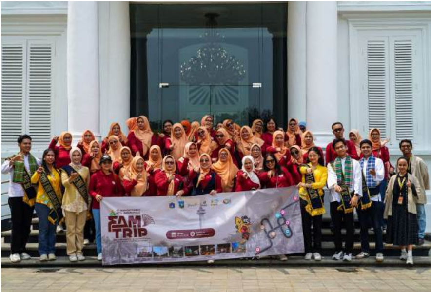
Anggota DWP mengikuti Familiarization Trip (Famtrip) Jelajah Keindahan Kota Jakarta Pusat.