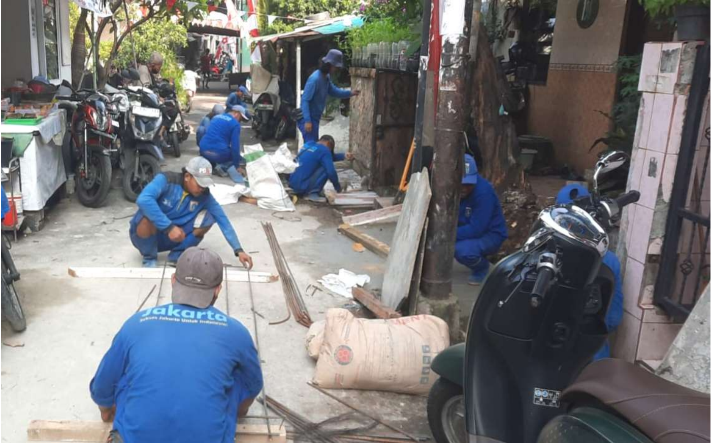
Personel SDA sedang mengerjakan penutupan saluran.

Perekonomian & Pemb 7 Aug, 2025 Reporter: Andre | Editor : Andreas Pamakayo