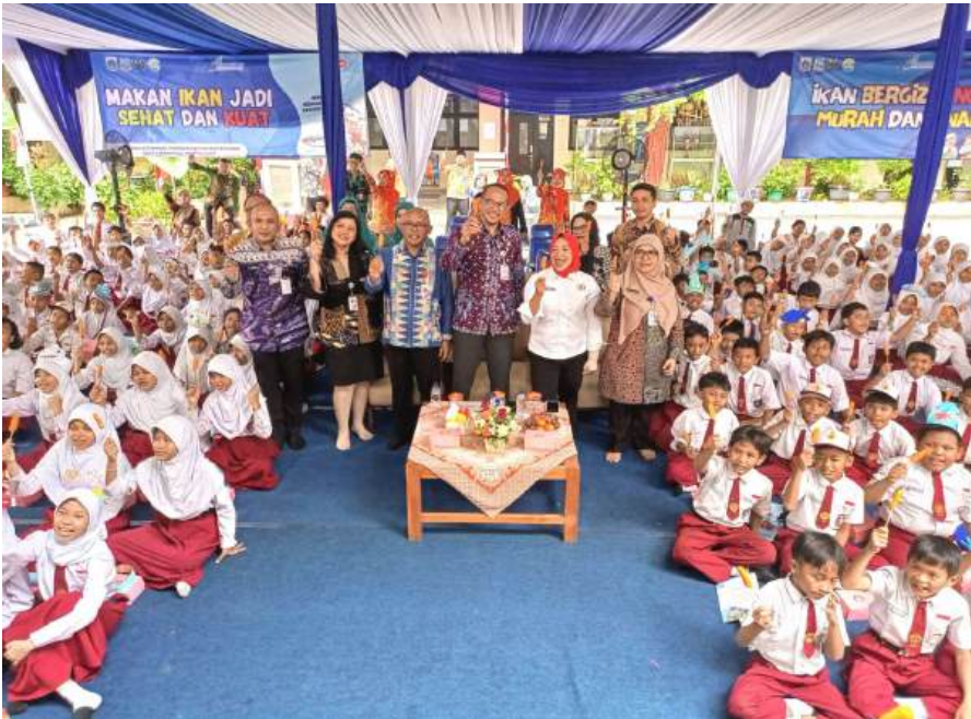
Safari Kampanye Gemarikan di SDN 01 Mangga Dua Selatan.

Perekonomian & Pemb 7 Aug, 2025 Reporter: Andre | Editor : Andreas Pamakayo