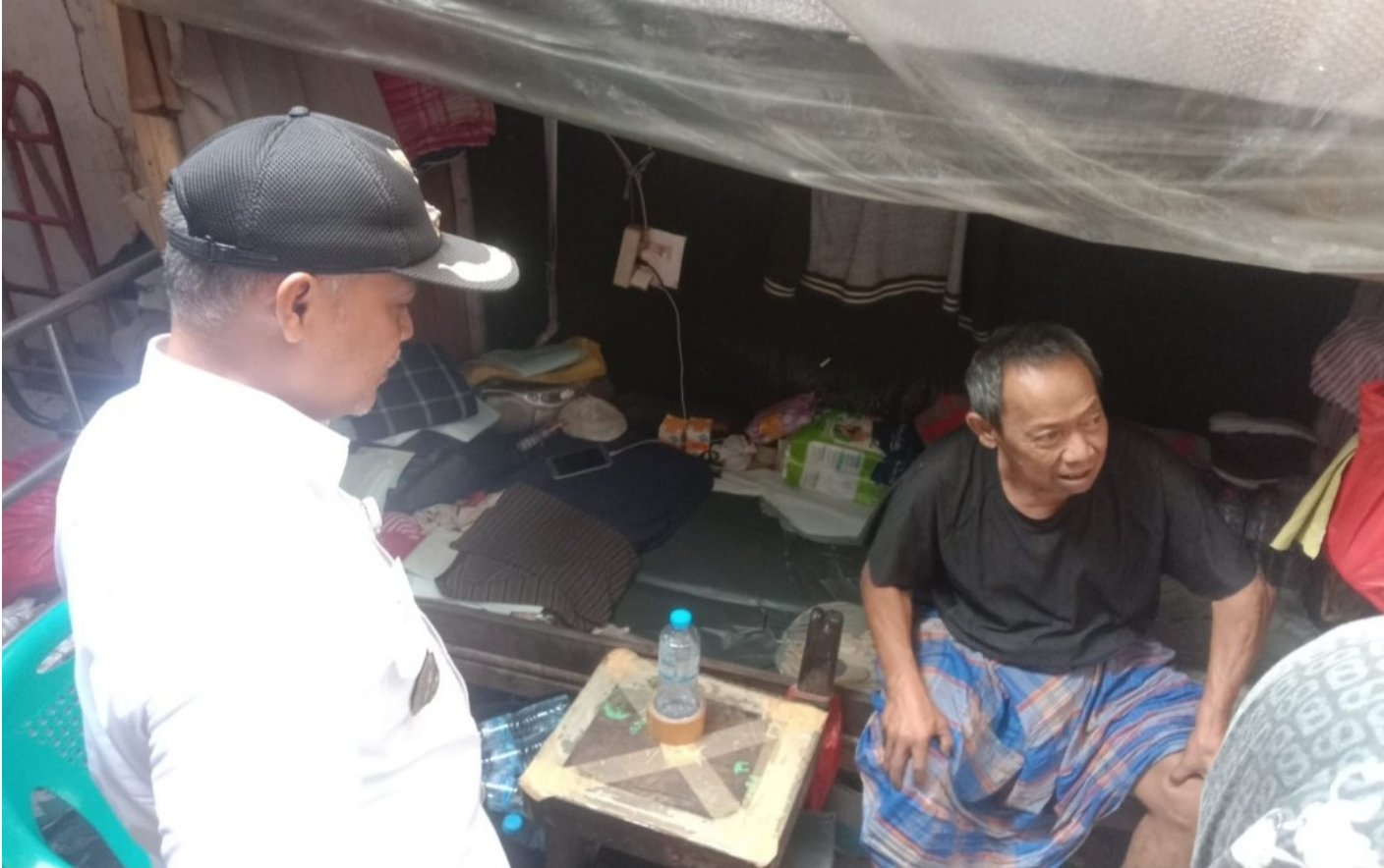
Camat Cempaka Putih kunjungi Marhasan yang sedang sakit.

JAKARTA – Pemerintah Kecamatan Cempaka Putih hadir membantu warga Kelurahan Cempaka Putih Barat (CPB) yang sedang sakit.