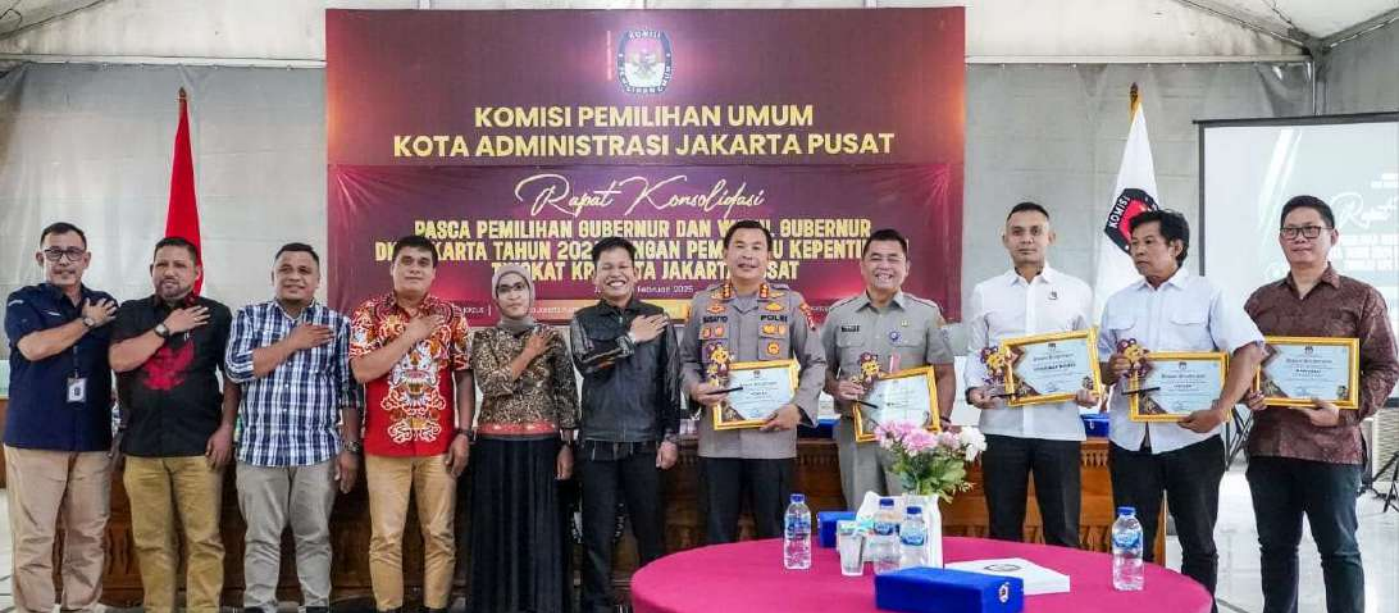
Konsolidasi Pasca Pemilihan Gubernur dan Wakil Gubernur DKI Jakarta Tahun 2024.

Pemerintahan 11 Feb, 2025 Reporter: Dwi Arif | Editor : Andreas Pamakayo 22 View