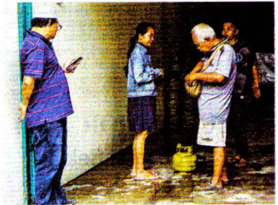
HANUNG HAMBARA/JAWA POS

"Kami akan atur sesuai dengan pengguna LPG 3 kilogram di Jakarta. Siapa yang berhak terima, database -nya kita lengkap. Nah, nanti menurut dari Dinas Perdagangan (Dinas PPKUKM, red ) mau dibikin kayak Qris. Begitu