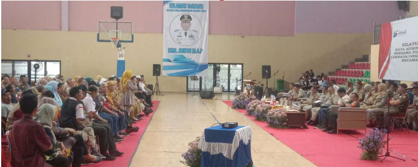
Pemkot Administrasi Jakarta Pusat menggelar silaturahmi bersama tokoh masyarakat dan lembaga organisasi kemasyarakatan Kecamatan Cempaka Putih.

JAKARTA -Untuk membangun sambung rasa serta membangun komunikasi silaturahmi dengan lembaga organisasi kemasyarakatan Kecamatan Cempaka Putih.