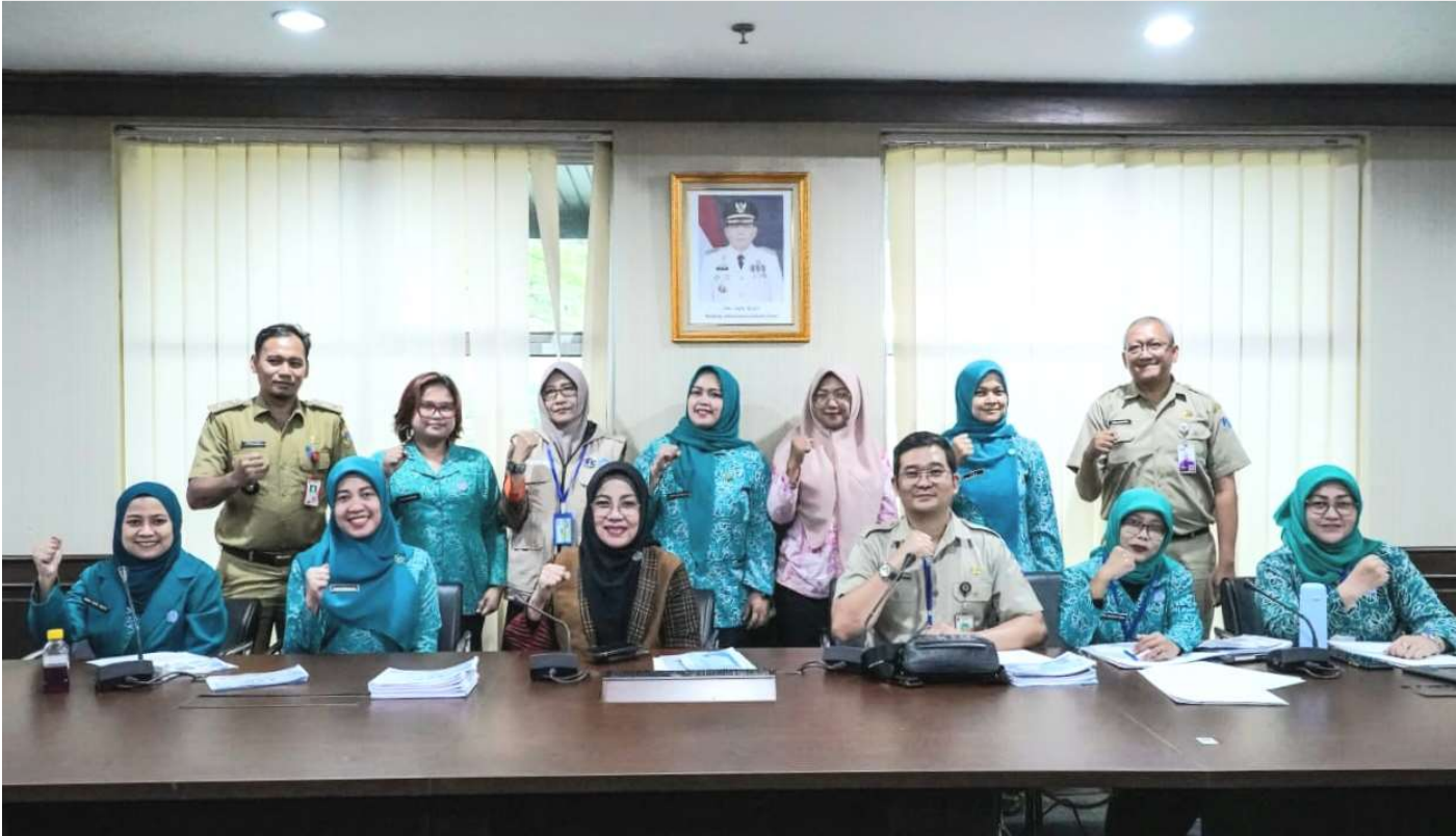
Usai paparan 10 Program Pokok PKK Kelurahan Cempaka Putih Timur.