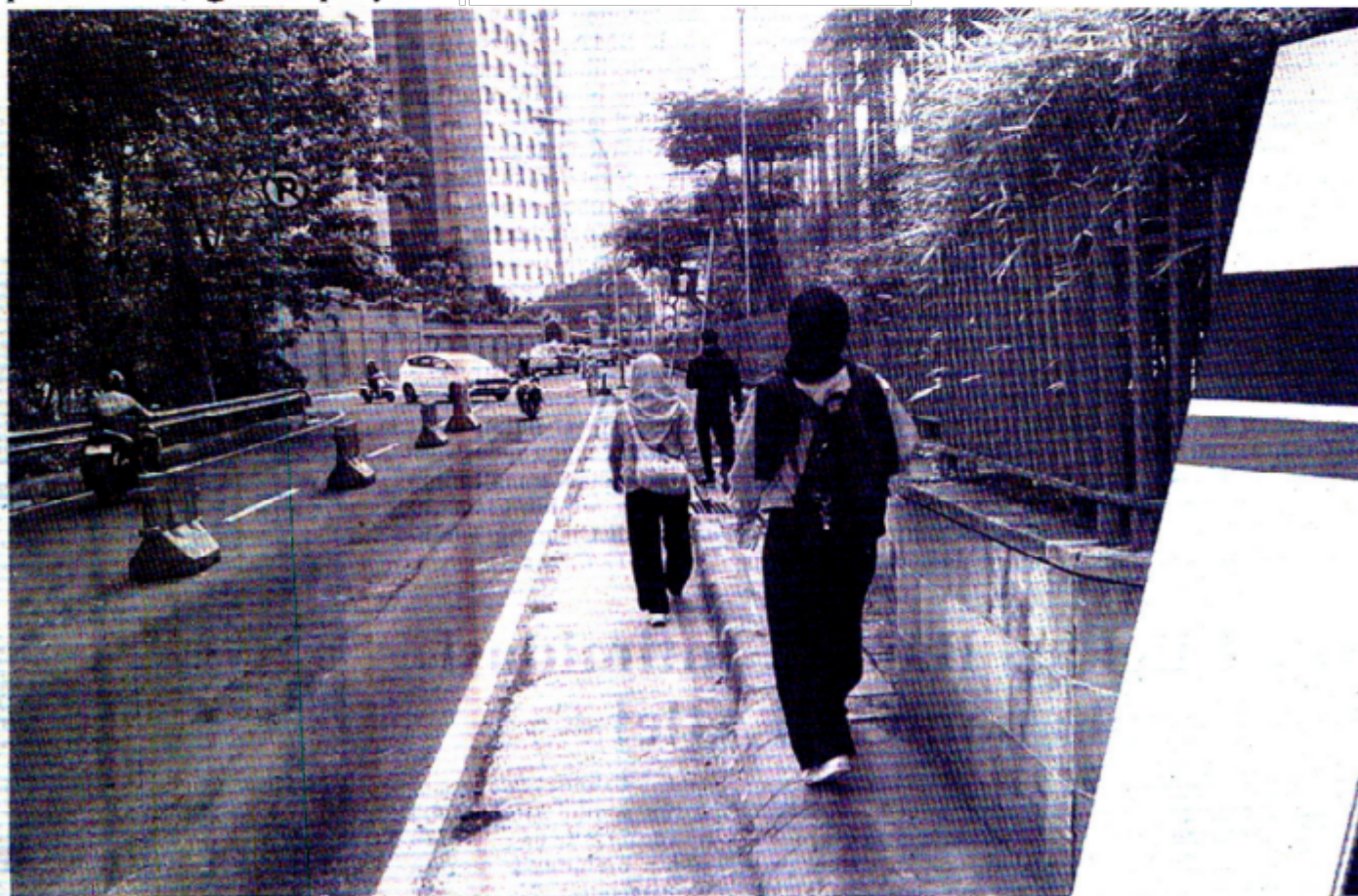
TROTOAR - Trotoar di sekitar Mall GI, Jakarta Pusat, dipangkas.

Penyempitan trotoar sempat menjadi sorotan warga karena dinilai mengganggu pejalan kaki dan mengurangi kenyamanan kawasan strategis tersebut. Namun, pemerintah memastikan bahwa langkah ini bersifat teknis dan telah melalui prosedur resmi. (pan)