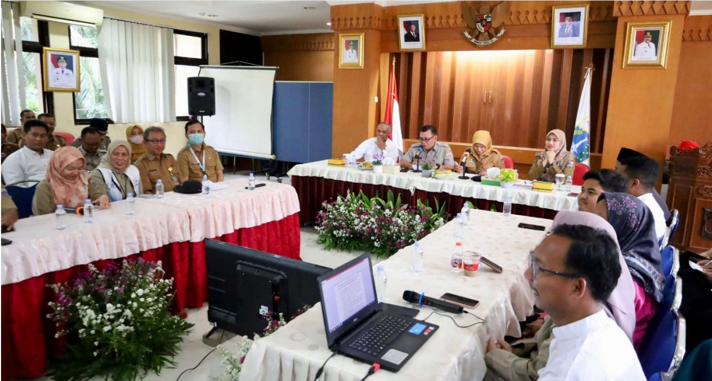
Kelurahan Cempaka Putih Barat melaksanakan paparan secara virtual dalam ajang perlombaan Kampung KB.

Kesra 17 Jun, 2025 Reporter: Zaki Ahmad Thohir | Editor : Andreas Pamakayo