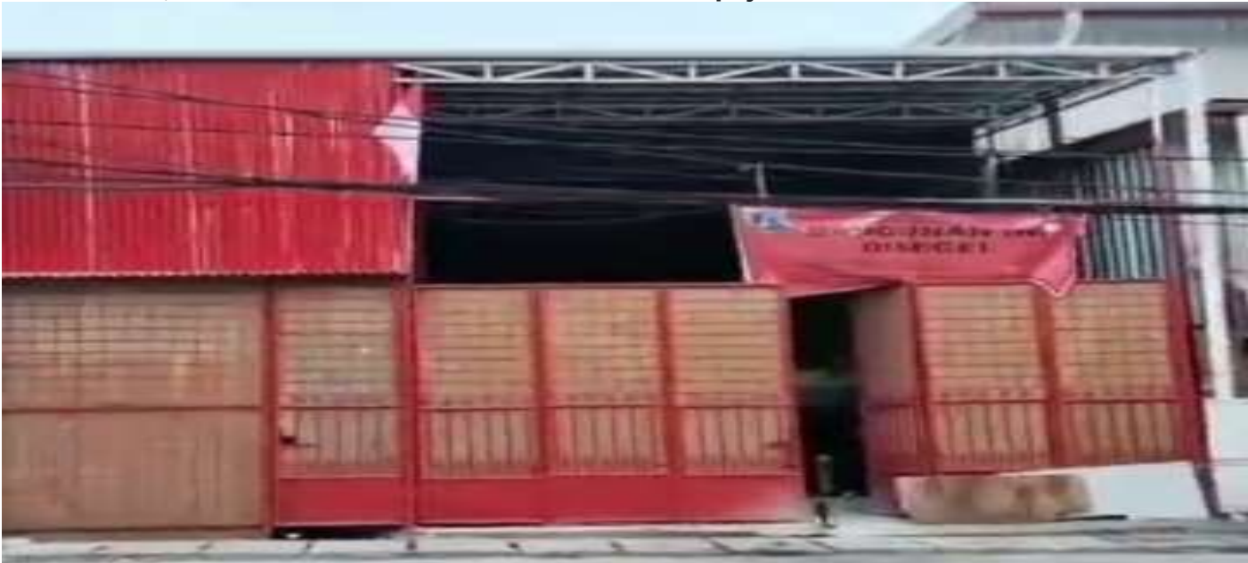
Pembangunan Disegel - terletak di, Jalan Rasela 1 no: 55 GSU Sawah Besar Jakpus, meski disegel pembangunan ini tetap dikerjakan para kuli bangunan.

HELOINDONESIA.COM - Kinerja pengawasan bangunan Suku Dinas (Sudin) Cipta Karya Tata Ruang dan Pertanahan (CKTRP) Jakarta Pusat (Jakpus) dipertanyakan Dewan Kota (Dekot) Jakpus.