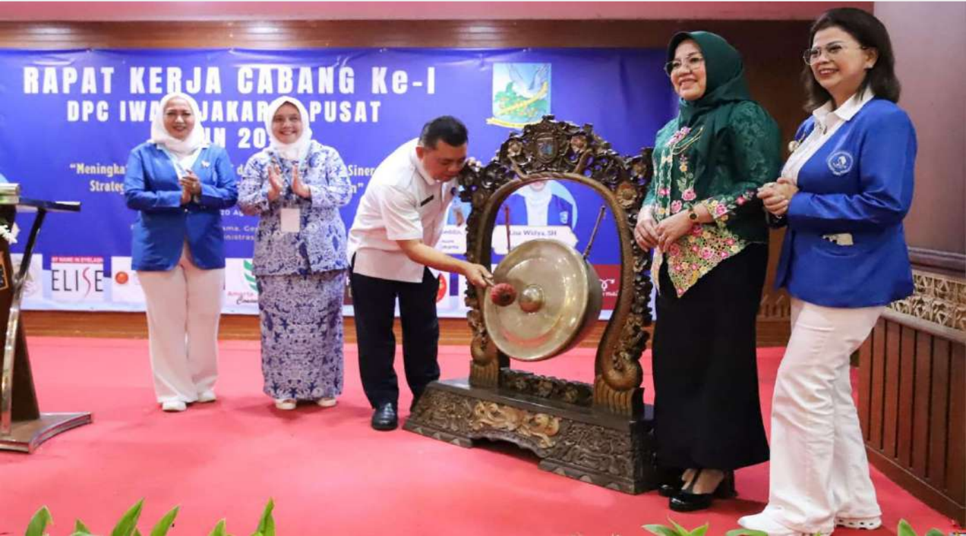
Sekko membuka rakercab IWAPI.

Perekonomian & Pemb 20 Aug, 2025 Reporter: Rio Cornelianto | Editor : Andreas Pamakayo