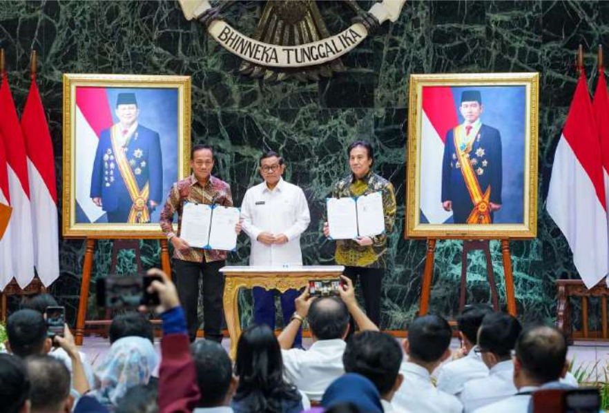
Peluncuran Platform Portal e-Guarantee dan Sistem Penjamin Digital, di Balai Kota DKI Jakarta, Rabu (20/8).

Perekonomian & Pemb 20 Aug, 2025 Reporter: R Maulana Yusuf | Editor : Andreas Pamakayo