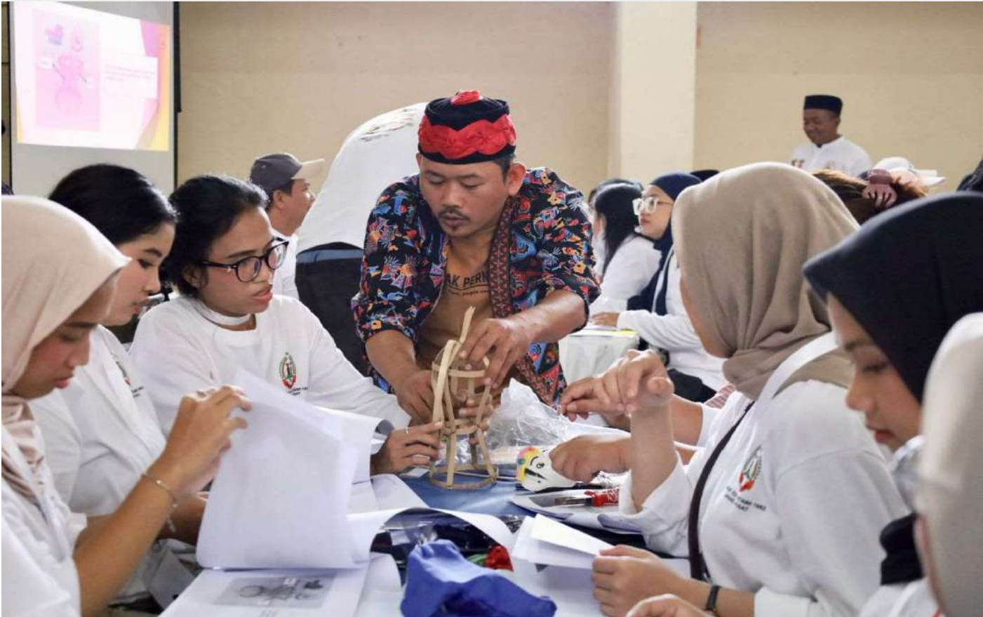
Pelatihan pembuatan Souvenir Betawi.

Kesra 20 Aug, 2025 Reporter: Berlian Sigit | Editor : Andreas Pamakayo