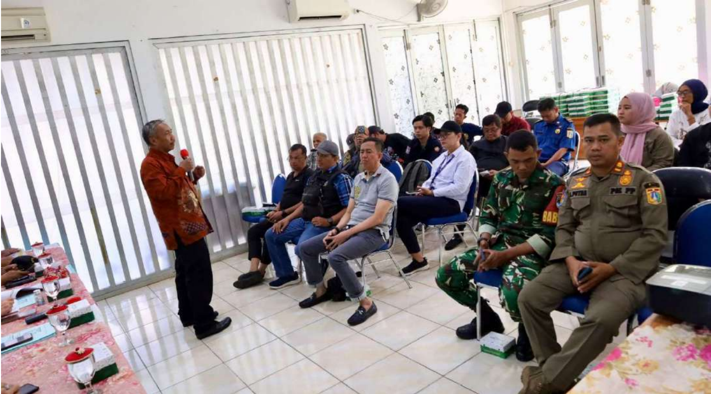
Sosialisasi Pos Bantuan Hukum.

Pemerintahan 23 Oct, 2025 Reporter: Zaki Ahmad Thohir | Editor : Andreas Pamakayo