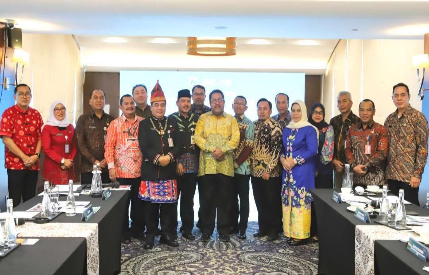
Penjurian Benyamin Award 2025, di Hotel Indonesia Kempinski, Jakarta Pusat, Kamis (23/10).

Perekonomian & Pemb 23 Oct, 2025 Reporter: Malik Maulana | Editor : Andreas Pamakayo