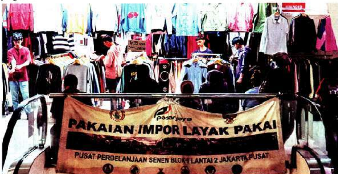
IMPOR: Suasana di Pasar Senen yang menjual pakaian bekas impor, Kamis (23/10). Pedagang di pasar tersebut mengaku was-was dengan rencana pemerintah yang akan menyetop aktivitas impor balpres pakaian bekas. Antara kebijakan itu mengancam mata pencapaian mereka.