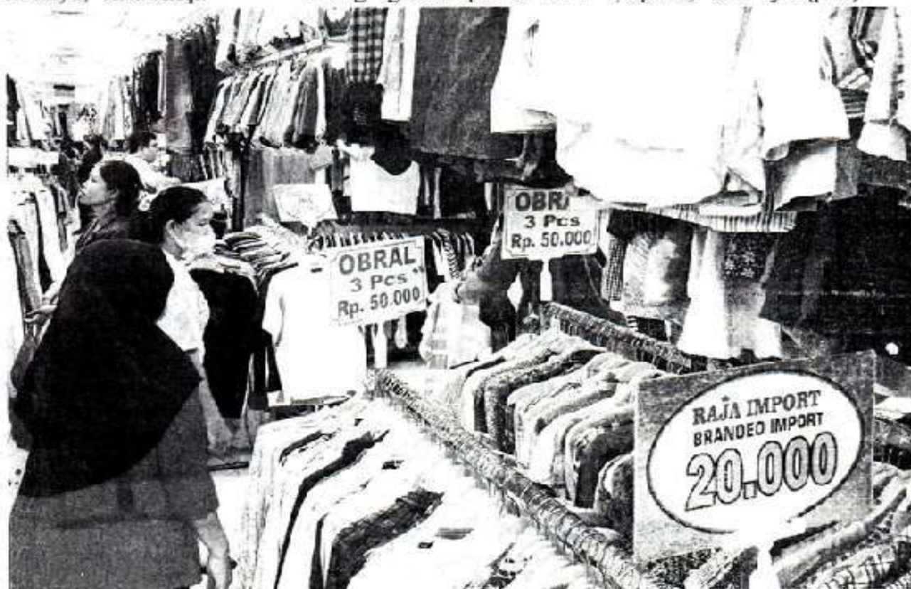
STOP: Sejumlah pengunjung memilih pakaian bekas impor di salah satu kios kawasan Pasar Senen, Jakarta Pusat, Kamis (23/10). Pemerintah berencana menyetop impor balpres pakaian bekas dan menggantinya dengan produk tekstil dalam negeri.

Ia menambahkan, penggunaan barang bermerek sering dikaitkan dengan peningkatan status sosial, sehingga tidak mengherankan jika aktivitas thrifting diminati banyak kalangan. "Orang bisa mendapatkan barang branded bekas dengan harga murah, itu yang membuat thrifting cukup populer," tuturnya. (pan)