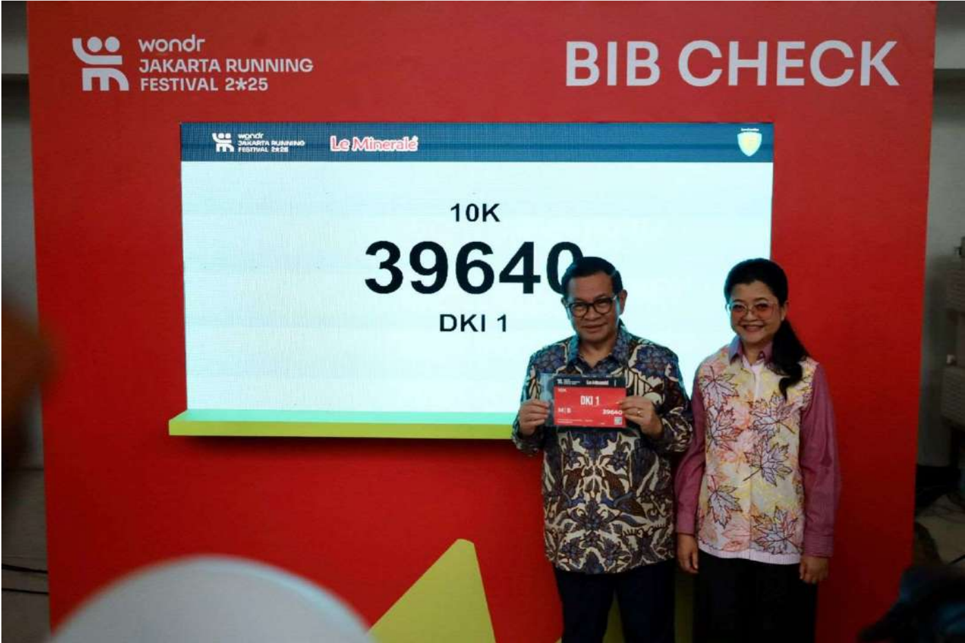
Gubernur DKI Jakarta Pramono Anung mengambil race pack Jakarta Running Festival.