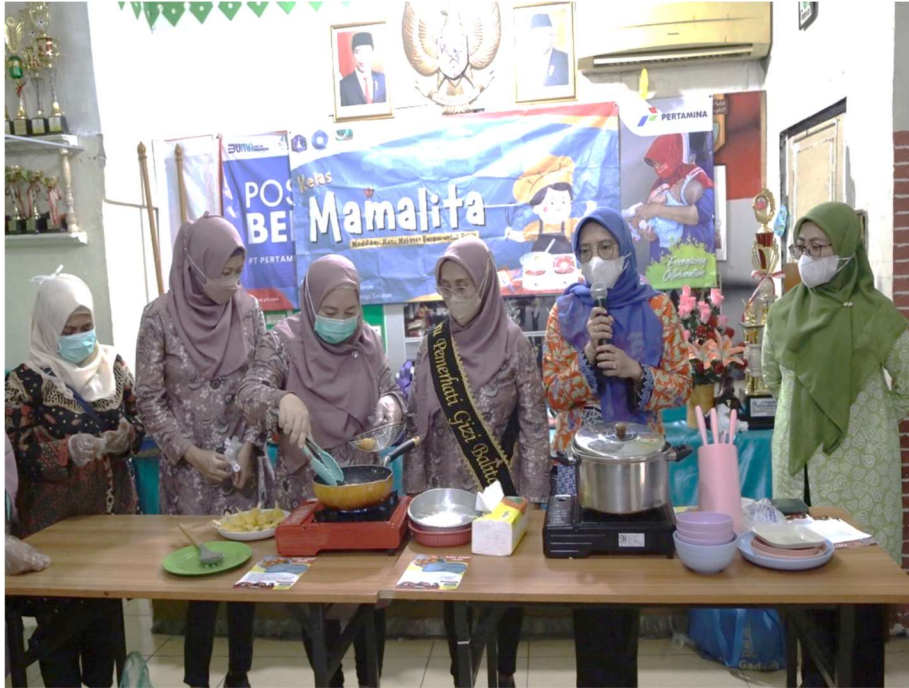
Kelas Mamalita atau Modifikasi Menu Makanan Bergizi untuk Balita.

Kesra 19 Jan, 2023 Reporter: Berlian Sigit/Danar | Editor: Andreas Pamakayo